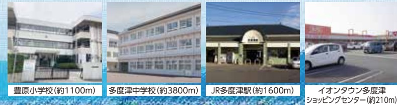
豊原小学校(約1100m) 多度津中学校(約3800m) JR多度津駅(約1600m) イオンタウン多度津ショッピングセンター(約210m)